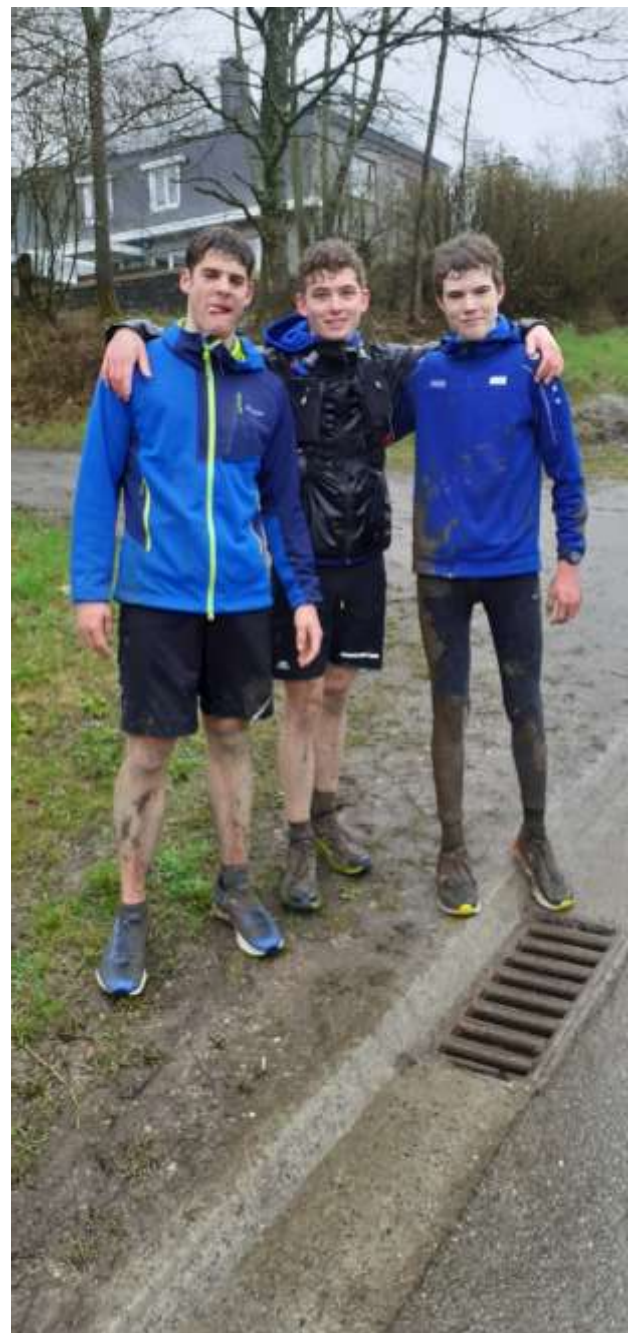
Trial de la soupe 21 km 11/04/2021